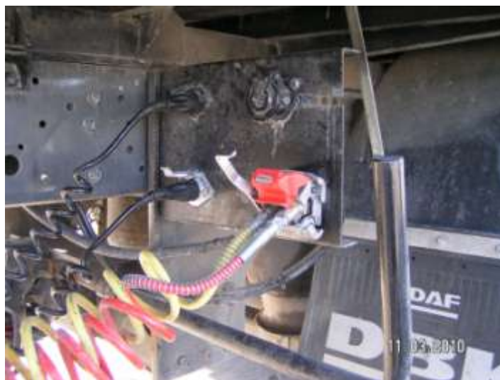
Podłączenie do pojazdu silnikowego przewodów hamulcowych przyczepy