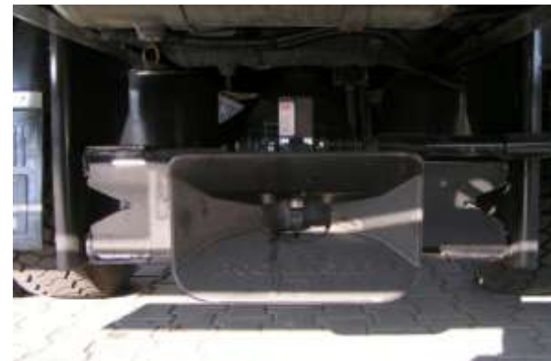
Podniesienie sworznia urządzenia sprzęgającego w samochodzie.