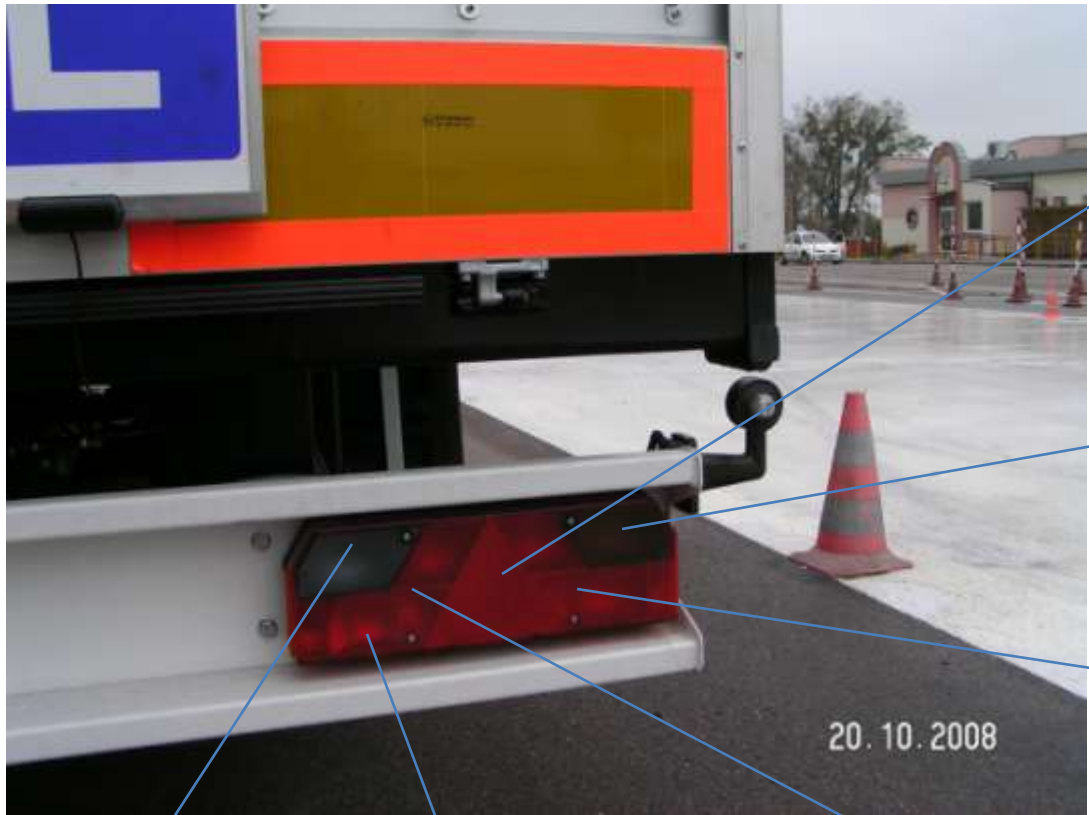
światło odblaskowe trójkątne