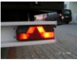
Światło hamowania „Stop”