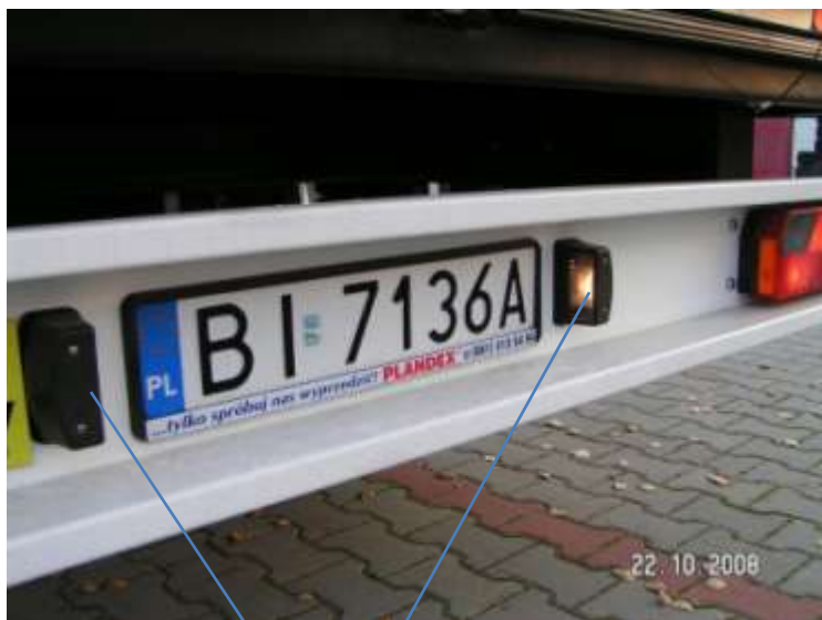
Oświetlenie tablicy rejestracyjnej