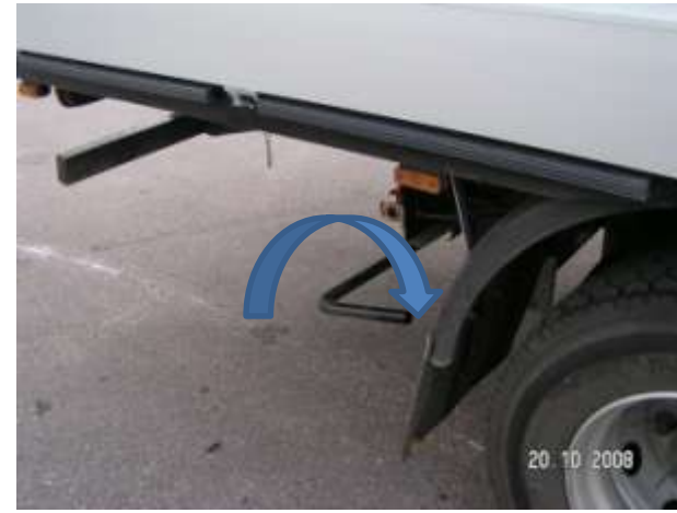
Położenie dźwigni przy uniesionym sworzniu