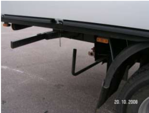
Położenie dźwigni przy opuszczonym sworzniu