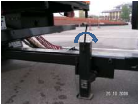
Podniesienie podpory przy pomocy korbki