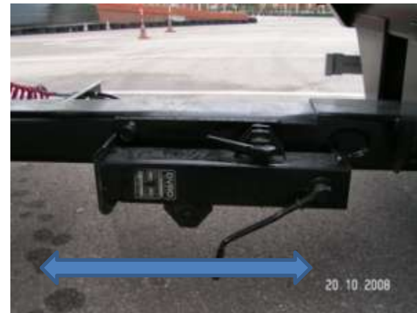
Zabezpieczenie podpory w położeniu poziomym

Podniesienie i zabezpieczenie podpory dyszla przyczepy.