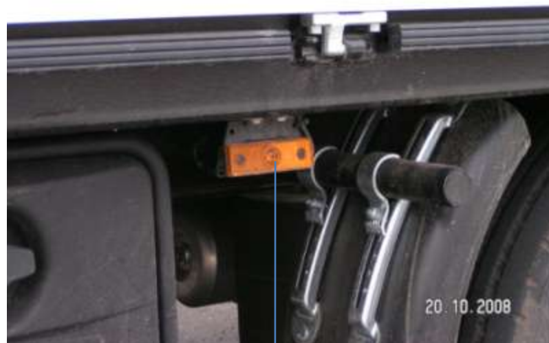
Światło pozycyjne boczne