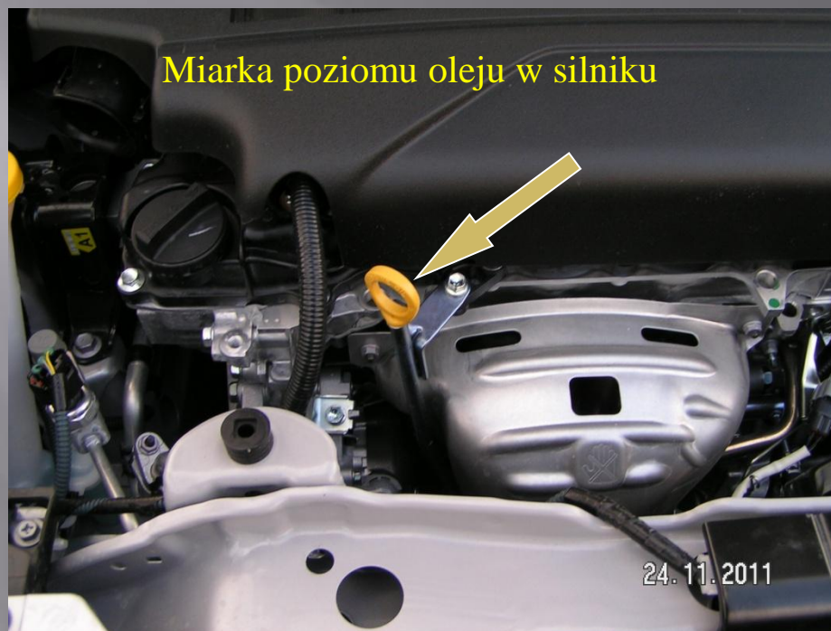
Znaczniki poziomu oleju w silniku